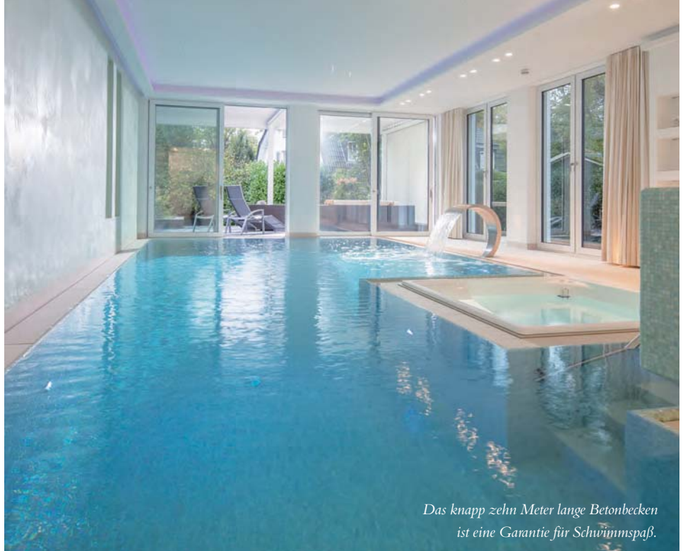
Das knapp zehn Meter lange Betonbecken ist eine Garantie für Schwimmspaß.

anlage wurden im Design-Center Modifikationen im Vergleich zum ursprünglichen Plan vorgenommen, wie wir auf Nachfrage erfahren: „Die Zuluffführung sollte jetzt, strömungstechnisch wesentlich günstiger, von unten nach oben über Schlitzschienen vor den Fensterelementen geführt werden. Die Verrohrung für die Luftführung, die Verrohrung der Gegenstromschwimmanlage und die Entwässerungspunkte der Überlaufrinne wurden bereits in der Rohbauphase auf einer Höhe von ca. 2,75 Meter vorverrohrt und in die Wand einbetoniert. Die gesamte Konstruktion wurde auf einer Breite von ca. 0,75 Meter in drei Schichten realisiert (Kelleraußenwand, Rohrführung und Beckeninnenwand). Gleichzeitig musste der Standard WU Beton erhalten bleiben.“