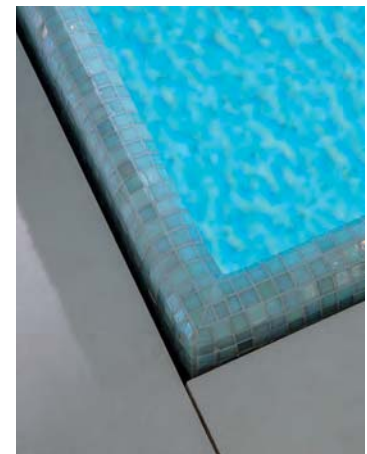
Die flüsternde Überlaufrinne ist Präzisionsarbeit.

Beim Bau des Dampfbads kam das spezielle Wedi-System zum Einsatz, das dem Bauherrn Schwitzvergnügen auf höchstem Niveau garantiert. Und wenn sich ein Familienmitglied etwas höhere Temperaturen wünscht, dann kann es auf die daneben verbaute Sauna ausweichen.