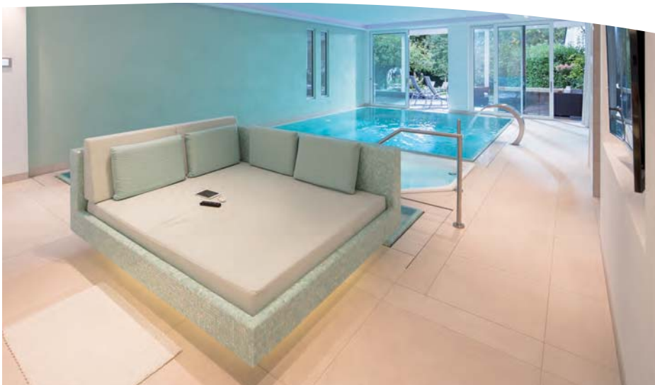
Bild linke Seite Die Schwimmhalle besitzt aufgrund der Lage eine natürliche Verbindung zum Garten.